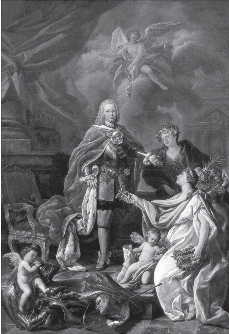
Fernando VI como protector de las Ciencias y las Artes o Alegoría de la Fundación de la Academia