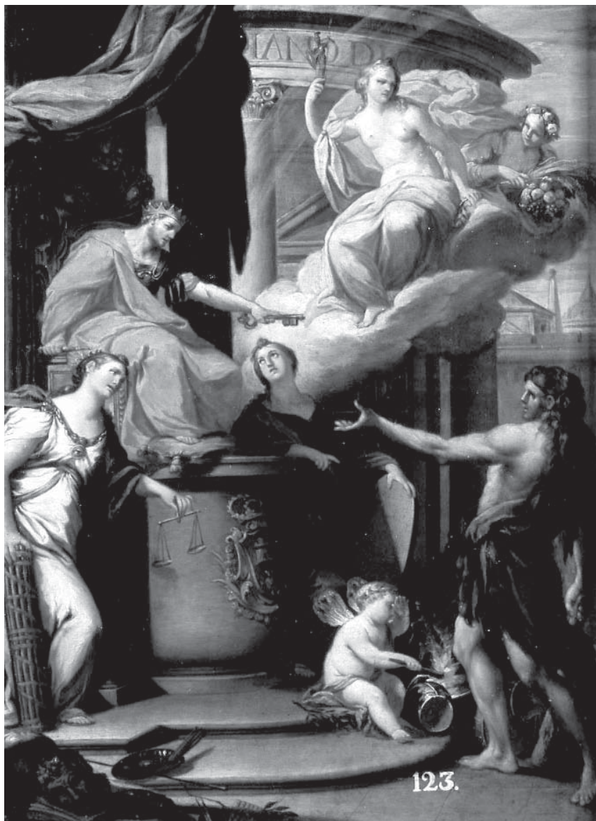
Alegoría de la Paz.