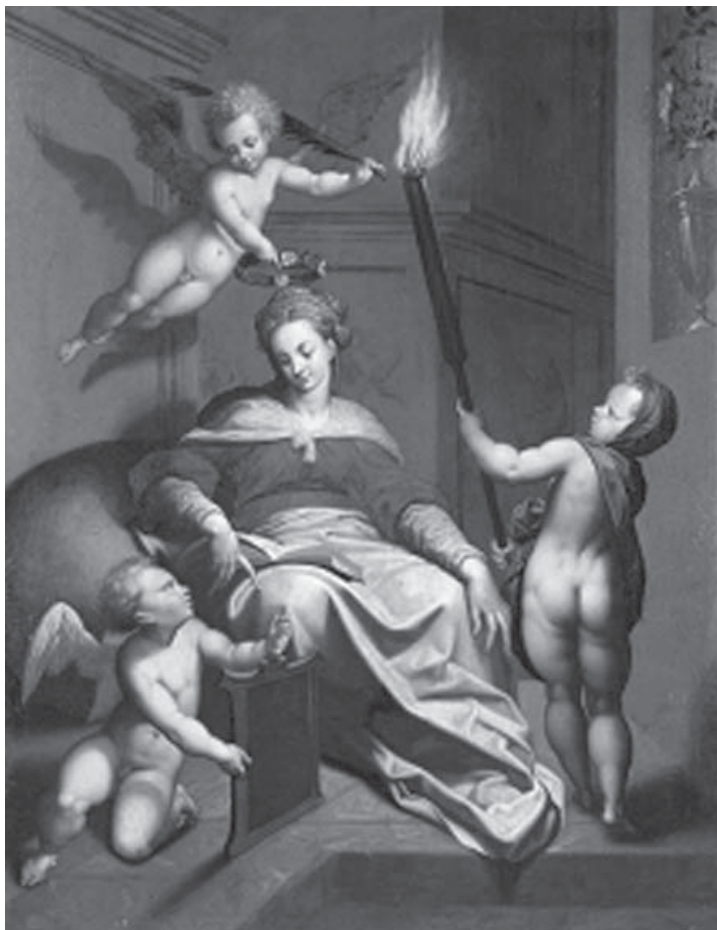
Alegoría de la Sabiduría.