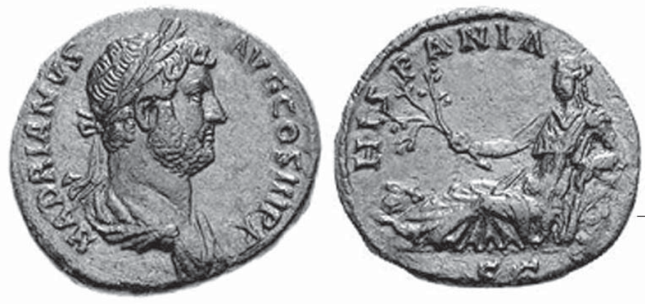
Alegoría de Hispania en una moneda romana de Adriano.