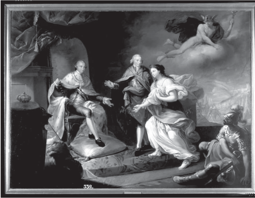
Godoy presenta la Paz a Carlos IV.